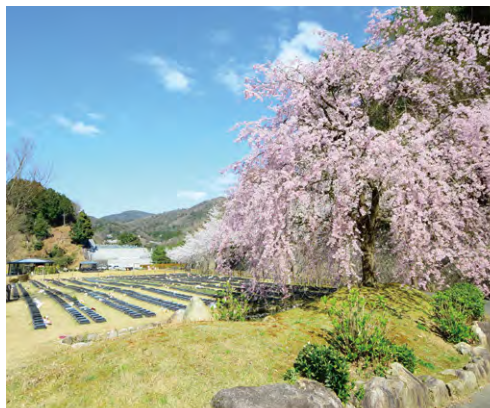
京都天が瀬メモリアル公園