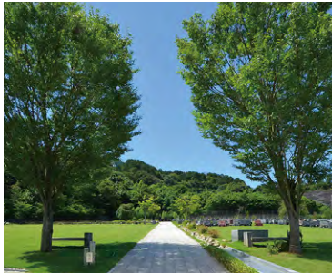
京都天が瀬メモリアル公園