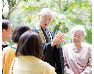
東京本院 新宿瑠璃光院