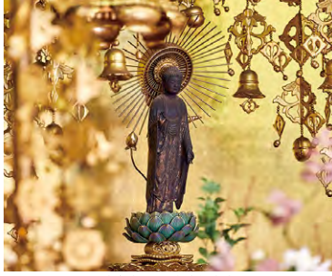
岐阜本坊 阿弥陀如来像

さまざまな施設でやすらぎをお届けしているほか、折に触れ、気軽に文化や歴史に触れることができるイベントも行っています。ぜひ一度、東京、京都、沖縄など各地にあるお近くの光明寺までお越しください。