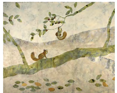
町家光明寺 参拝室壁画