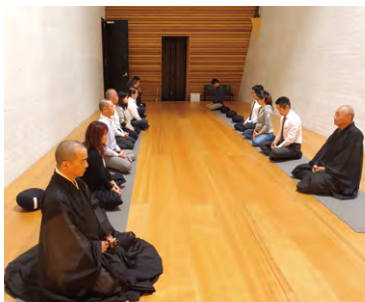
東京本院 新宿瑠璃光院「マインドフルネスと薬膳粥の会」