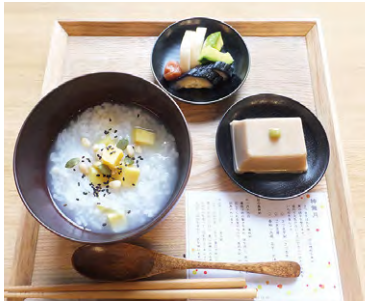
東京本院 新宿瑠璃光院「薬膳粥」