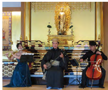
沖縄別院 琉球識名院 七夕まつり