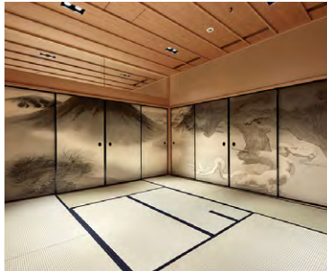
東京本院 新宿瑠璃光院 白書院「生々流転」