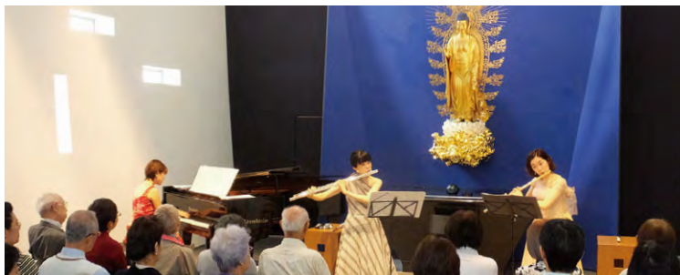
東京本院 新宿瑠璃光院「土曜の午後のコンサート」