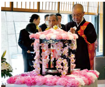
東京本院 新宿瑠璃光院「花まつり」