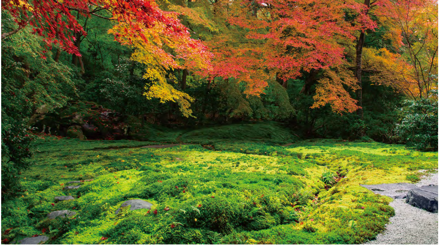
京都本院 瑠璃光院「瑠璃の庭」

岐阜本坊 東京本院 新宿瑠璃光院 京都本院 瑠璃光院 町屋光明寺 千葉光明寺 埼玉光明寺 琉球識名院