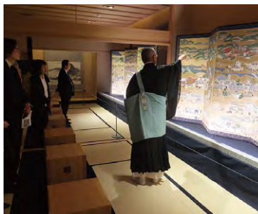
東京本院 新宿瑠璃光院 寺宝公開