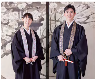
大梅副住職(左)と大洞住職(右)