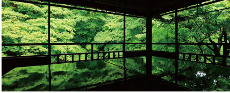
京都本院 瑠璃光院