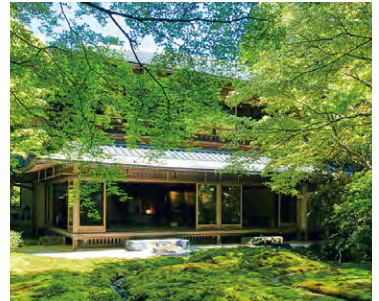
京都本院 瑠璃光院 庭園