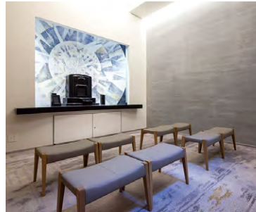
東京本院 新宿瑠璃光院 白蓮華堂「特別参拝室」