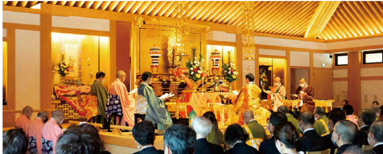
琉球識名院「落慶法要」