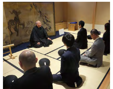
東京本院 新宿瑠璃光院 白書院