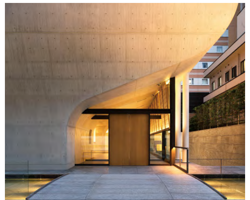
東京本院 新宿瑠璃光院 白蓮華堂